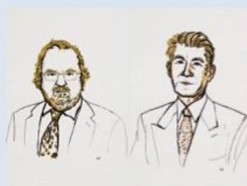
Jim Allison Tasuku Honjo Nobel Prize 2018